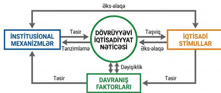
Şəkil 1: Dövrüyyəvi iqtisadiyyatın institusional və davranış qarşılıqlı təsir modeli